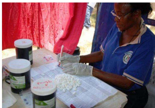
Cấp phát thuốc

Kho thuốc được bảo vệ kỹ lưỡng để chống trộm cắp. Nhân viên trung tâm ReachOut ghi chép sổ sách một cách tỉ mỉ. Trong khi một số tổ chức từ thiện không được tiếp tục tiếp nhận các chuyến hàng thuốc ARV (vật tư y tế thường bị trộm cắp hoặc quản lý kém, mang lại lợi nhuận cho những kẻ ngoài vòng pháp luật thay vì mang lại sức khỏe cho bệnh nhân), Trung tâm kiểm soát dịch bệnh Hoa Kỳ luôn ca ngợi thành tích hoạt động của trung tâm ReachOut là gương mẫu. Trên thực tế, các phòng khám HIV ở các nước