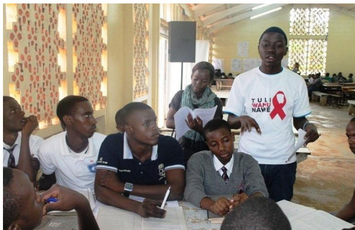
Khoá huấn luyện dành cho các nhân viên tư vấn

Điều ấn tượng nhất là mọi người đều vui cười. Nụ cười không phải là một thứ có thể dễ dàng gắn với cuộc khủng hoảng AIDS ở châu Phi, nhưng các nhân viên và bệnh nhân tại trung tâm ReachOut có rất nhiều điều để vui cười. Năm 2001, Cha Joseph Archetti, một nhà truyền giáo dòng Comboni, đã nhận ra một chuyển biến mới tại giáo xứ của ngài, giáo xứ Đức Mẹ Châu Phi ở Mbuya gần thành phố Kampala, thủ đô của Uganda. Ngày càng có nhiều linh mục được mời đến để xúc dầu và ban phép bí tích cho những người hấp hối. Nhiều giáo dân mắc bệnh AIDS và Cha Archetti bắt đầu tự hỏi liệu giáo xứ có thể làm nhiều hơn là chỉ an ủi những người hấp hối hay không. Từ một dự án thí điểm khởi đầu trong một căn phòng ở tầng hầm nhà thờ và phục vụ 14 bệnh nhân, trung tâm ReachOut đã phát triển lên hơn 20.000 bệnh nhân và hỗ trợ hơn 1.000 trẻ mồ côi. Trung tâm có thêm những cơ sở khác ở Kampala và các vùng nông thôn của Uganda. Cha Paolino Twesigye, linh mục chính xứ hiện nay, đã chia sẻ một trong những bí quyết khiến trung tâm ReachOut thành công: kho cất giữ thuốc ARV (thuốc kháng virus HIV) do Trung tâm kiểm soát dịch bệnh Hoa Kỳ cung cấp.