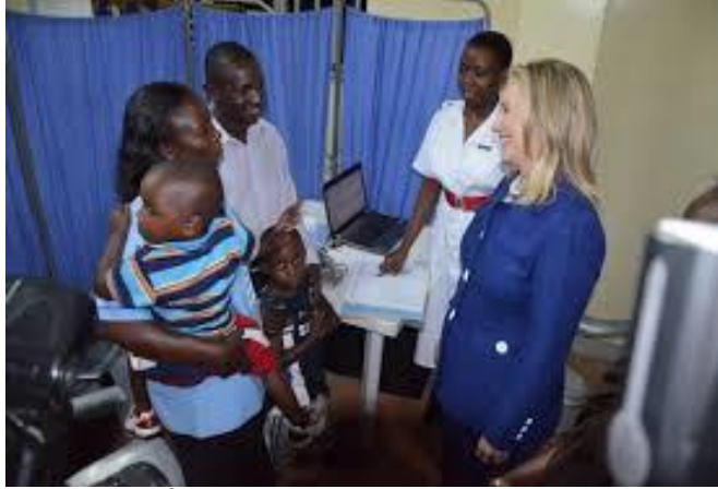
Một chuyến thăm của cựu Bộ trưởng ngoại giao Hoa Kỳ

làng giềng đã đến thăm Mbuya để tìm hiểu các hoạt động tốt nhất của Trung tâm.